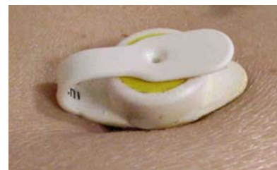
皮膚のボタン部分